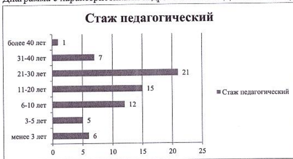
Диаграмма с характеристиками кадрового состава Детского сада (в чел.)

С 01.09.2023 Детский сад применяет профстандарт педагога-дефектолога, утвержденный приказом Минтруда от 13.03.2023 № 136н. В результате быстро «закрылись» вакантные должности специалистов, и Детский сад может оказывать эффективную помощь и сопровождение воспитанникам по запросу родителей.